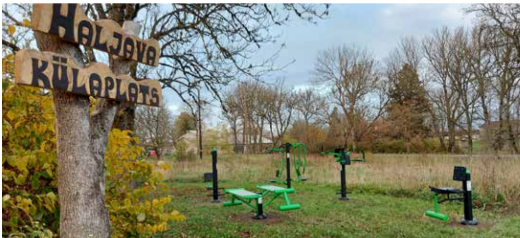
Haljava külaplatsi väljõusaal on mõeldud avalikuks kasutamiseks. Oodatud on erinevas vanuses, kaalus ja soost spordisõbrad.

See pani Haljava külaseltsi aktiivsed liikmed mõtlema mölgutama ja arutama, et külaplatsile kuluks ära väljõusaal. Mõeldud, tehtud. Külaselts taotles kevadel Har-