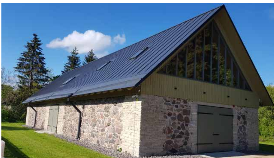
Kostiferi Puhkekeskus (Seene 3, Kostivere).

OÜ Raidmaa pälvis Kostiferi Puhkekeskuse avamisega Leader ettevõtlusprojekti eripreemia. Lisaks pälvis aasta tegijate konkursil aasta teo eripreemia Harjumaa viie valla ühisprojekt „Kõrvemaa Rattaring“ (Raasiku, Kose, Jõelähtme, Kuusalu ja Anija vald).