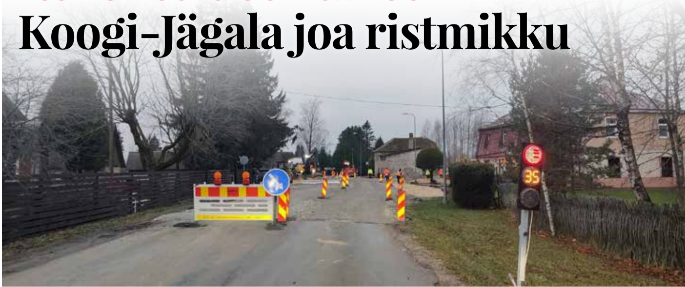
Foto: Koogi-Jägala jõe ristmik 16.11.2021