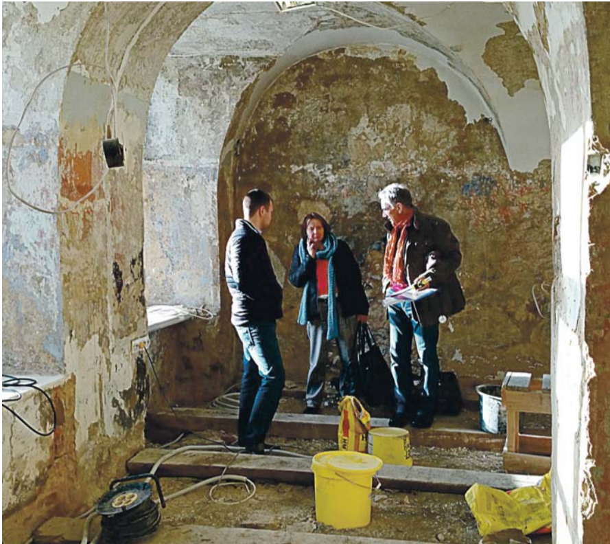
Põhja-Harju Koostöökogu koostöös Jõelähtme vallavalitusega asus kontoriruumide restaureerimise 2015. aasta veebruaris. Pika ja keerulise töö tulemusena on tänaseks esimese korruse vasak tiib peaaegu terveni restaureeritud.