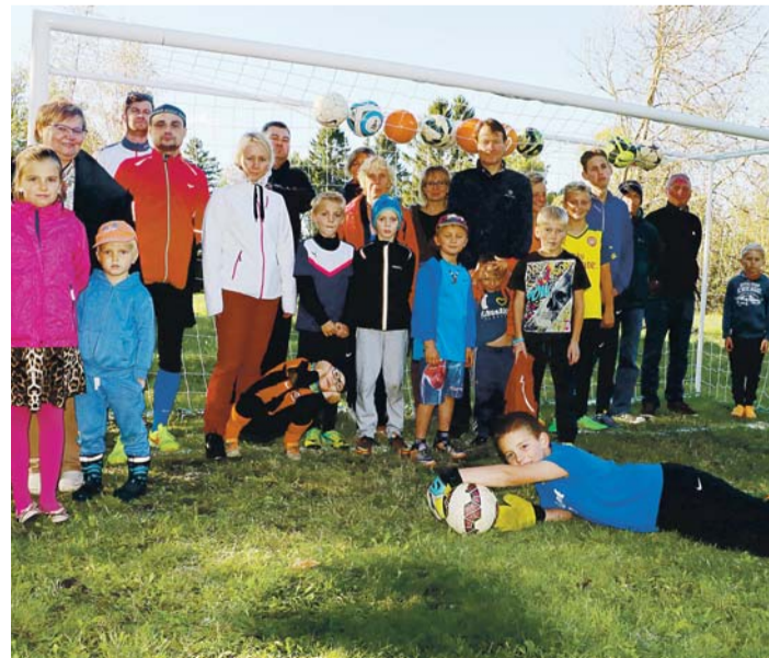
Suur tänu kõigile, kes kaasa löönud väljaku töödes, mängus, küpsetanud ja jookse seganud. Kohtumiseni järgmise projekti teostamisel!