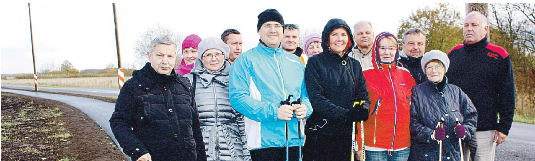
Grupp huvilisi tuli uut Loo-Liivamäe kergliiklusteed testima ja tegijaid tänama.