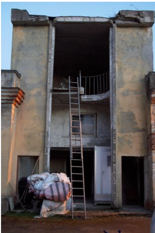
Foto 2. Hoone, kus asub veelendlaste koloonia varjupaik. Sissepääsuavad kolooniasse asuvad rõdu kohal laepaneelides.

Veelendlase poegimiskoloonia leiti Jägala joa hüdroelektrijaama hoonest (foto 1-4). Vestlusest kohalike elanikega selgus, et nahkhiirekoloonia on selles hoones asunud juba 1984. aastal, kui seal