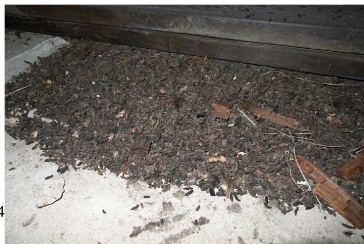
Foto 3. Nahkhiirte ekskremendid Jägala-Joa hüdroelektrijaama rõdul.