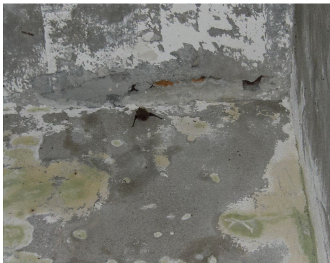
Foto 1. Veelendlane Jägala-Joa hüdroelektrijaama seinal.