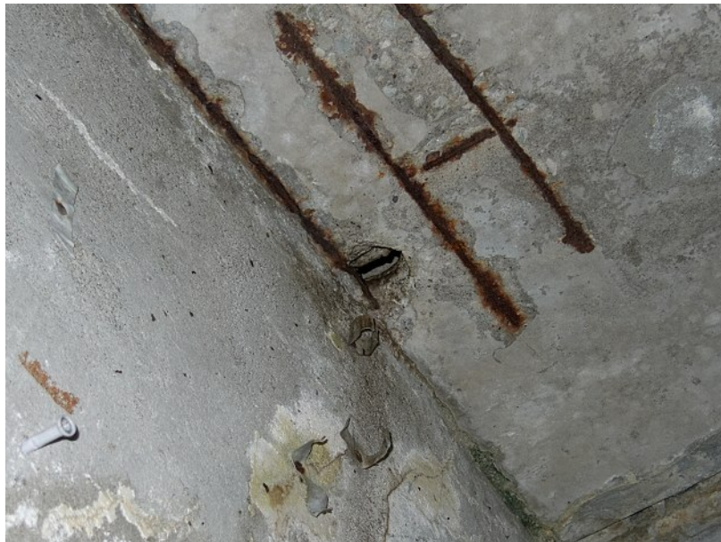
Foto 4. Üks veelendlase koloonia varjupaiga avadest.

oli pioneerilaager. Öiste vaatluste ajal oli nahkhiirekoloonia varjupaiga ees olev õu prožektoriga valgustatud, mis selgelt häiris nahkhiiri: nahkhiired vältisid lendamist valgustatud õue kohal. Varjupaika naastes lendasid nad kiirelt üle õue hoone taha, kus oli pimedam, tiirutasid seal mõnda aega ja lendasid seejärel võimalikult varjatud teed kasutades poolavatud rõdu kohale või alla tiirutama (vt foto 2). Nii rõdu kui ka selle all asuv poolavatud ruum olid vaatluste ajal prožektoriga otsese valguse eest varjatud. Mõnikord laskusid veelendlased puhkama seinale hoone poolavatud rõdu all (foto 1). Sisepääsuavad koloonia varjupaika (vähemalt 2 tk, üks neist on näha fotol 4) asusid rõdu kohal laepaneelides. Poegimiskoloonia varjupaik asub ilmselt betoonist laepaneelide vahel või paneelide sees olevates tühemikes. Laepaneele soojendab generaatoriruumist üles tõusev soe õhk. Nahkhiirte poegimiskoloonia asukoht betoonist või kivist hoones on Eesti tingimustes haruldane meie jaheda kliima tõttu, mis muudab sellised ehitised nahkhiirte poegimiskolooniate jaoks liiga jahedaks. Tõenäoliselt oleksid temperatuuritingimused veelendlase poegimiskolooniale ebasoodsad, kui elektriyaam seisaks, sest sel juhul generaatoritest soojust ei eralduks.