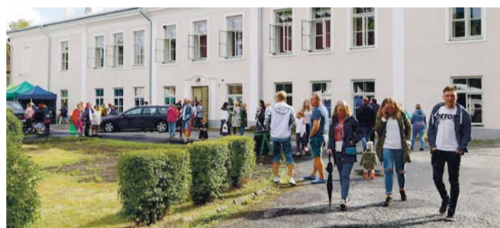
Väärika ajalooaga Kostivere mõisahoonet püüab pilku nii seest kui väljast.

Tänu dega Kostivere Kultuurimõis ning MTÜ Kostivere Selts. •