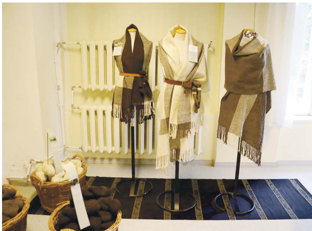
Pille Pappeli näitus „Villa Voldemari linad ja villad” Kostivere Kultuurimõisas.