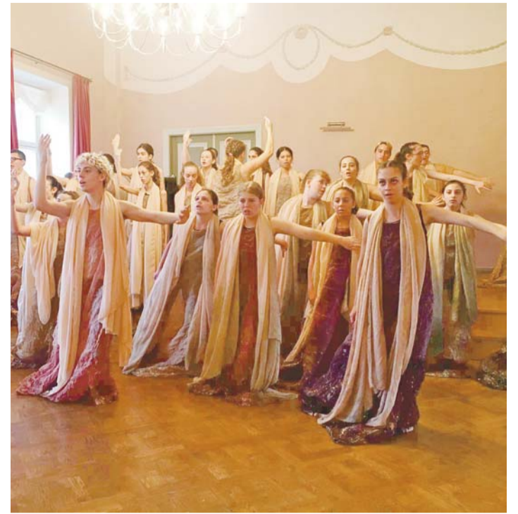
Iisraeli koor esitamas oma müstilist etendust.