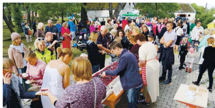
Kostivere naiste meisterdatud tordist said suu magusaks kõik mõisapäevade külalised.