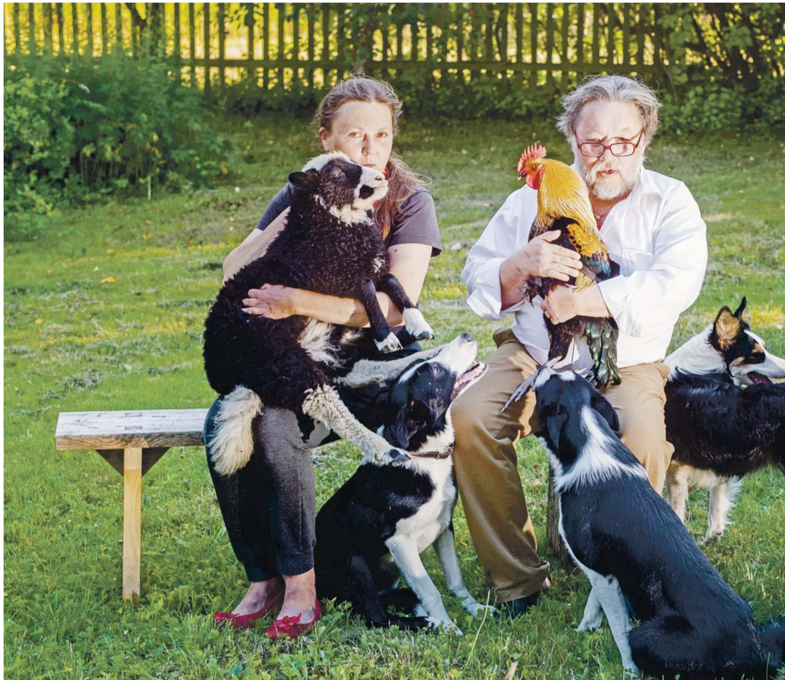
Välja talu pererahvas oma lemmikutega.

Et lambakasvatusega ära elada, tuleb oskuslikult majandada. See aga tähendab seda, et