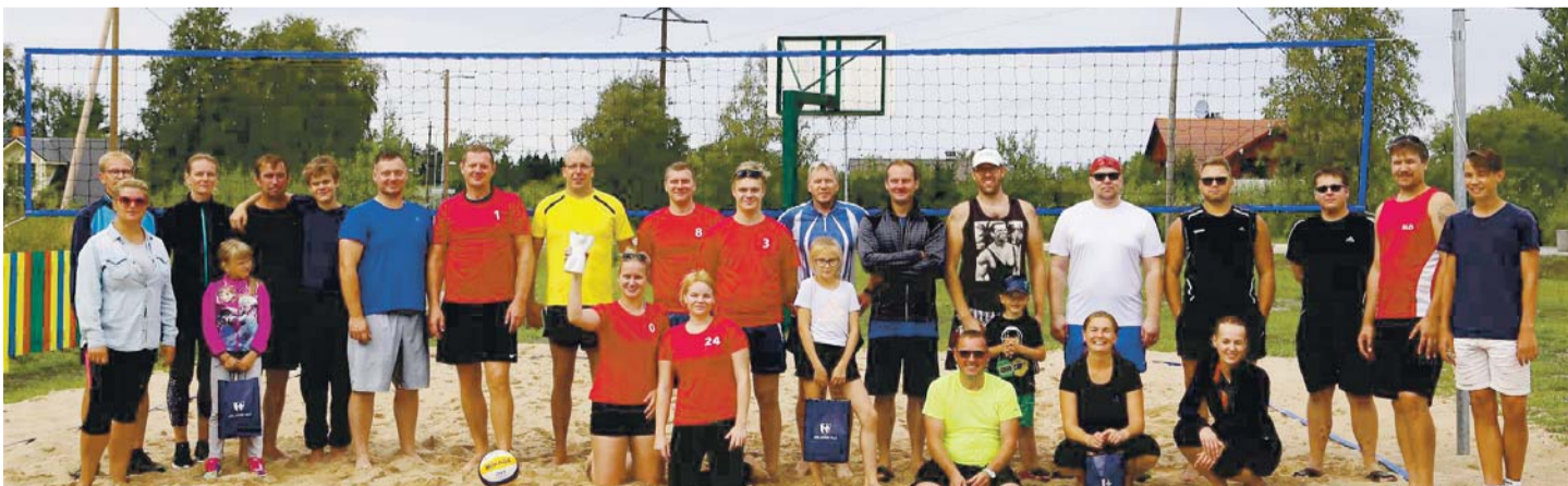
Valla külade võrkpalliturniiril Uuskülas osales seekord neli võistkonda.

T ingimused turniiri pidamiseks olid suurepärased: ilm soosis, liivaväljak oli heas korras, piisavalt publikut omasid toetamas, töötas ka puhvet, osalejad said suppi. Seekord osales neli võist-