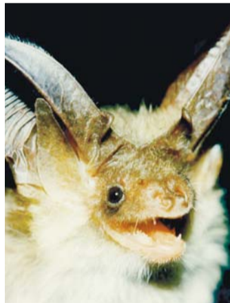
Pruun-suurkõrv (Plecotus auritus). Eestis metsa- ja pargiliik, elab ka Jägala jõe kallastel ning lendab Linnamäe paisjärve kohalgi.

kord olen leidnud öisel uuringul üles ka nahkhiirte koloonia päevase varjupaiga, kuid mitte sageli, selle ülesande jaoks on tänapäeval olemas muud uurimismeetodid.