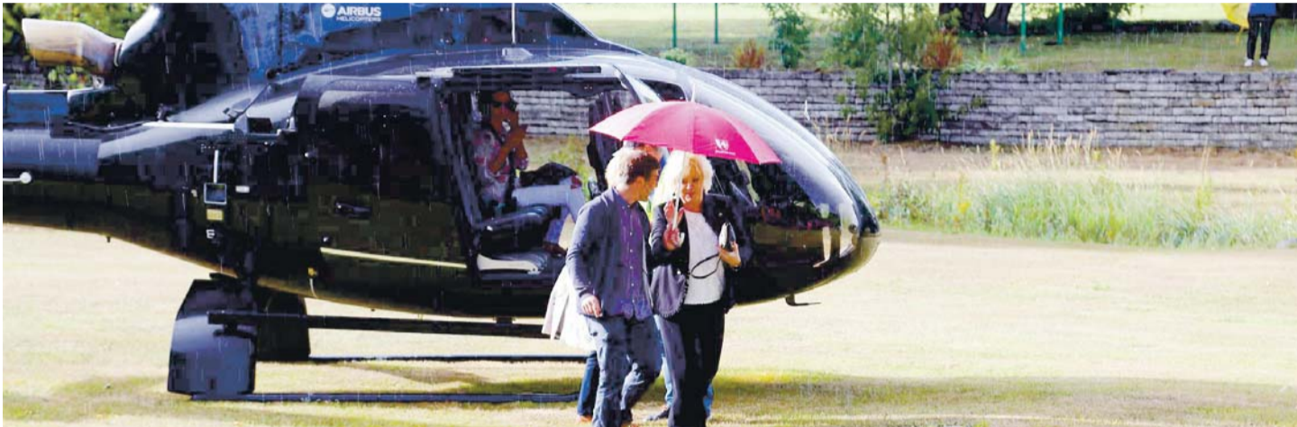
Anne Veski efektne saabumine Kostivere 10. mõisapäeva kontserdile helikopteriga.

Kostivere Kultuuri- mõisas kümnes mõisapäev alapealkirjaga „600 aastat mõisakultuuri” toimus 12. augustil. Kuna Kostivere alevikul ning mõisal on pikk ning huvitav ajalugu, otsustasid mõisapäeva korraldajad Eesti Vabariigi juubeliaastal pühendada mõisapäeva Kostivere küla ning mõisakultuuri ajaloolle.