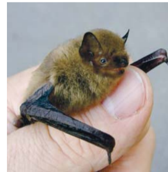
Pügmee-nahkhiir (Pipistrellus pygmaeus), rändliik, on Eestis üks haruldasemaid nahkhiiri, Põhja-Eestis on teada vaid kolm leiukohta. Tänavu suvel leitud toitumas Jägala joast allavoolu.