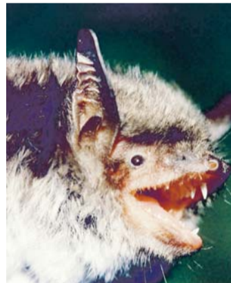
Tiigilendlane (Myotis dasycneme), Euroopas erilise kaitse all olev nahkhiireliik. Põhja-Eesti üks suuremaid suvekoolooniaid elab Linnamäe paisjärve piirkonnas.